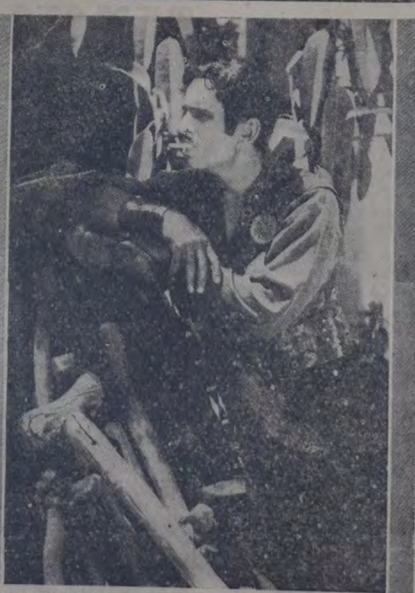
DOUGLAS FAIRBANKS, PROTAGONISTA DEL CINEDRAMA "EL GAUCHO", en una de sus escenas culminantes. El estreno de "El Gaucho", que se verificará el 23 del corriente, ha despertado gran interés.