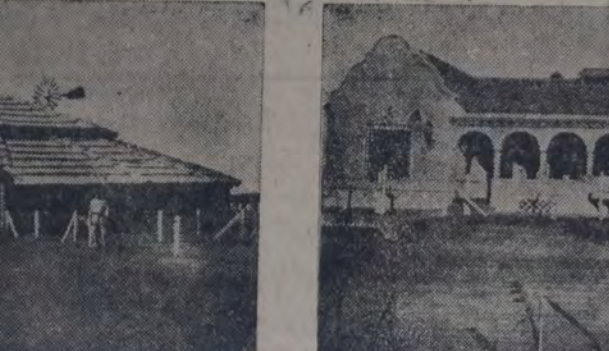
ARRIBA: UNA VISTA DE LA AMPLIA PILETA DE NATACION. — ABAJO, A LA IZQUIERDA: UNA DE LAS INSTALACIONES PARA PORCINOS. — A LA DERECHA: CASA HOGAR MODELO CONSTRUIDA, DESDE LOS LADRILLOS HASTA EL MOBILIARIO, POR LOS MEDIOS PROPIOS DEL ESTABLECIMIENTO.