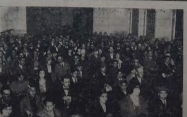
ASPECTO DEL SALON DE LA CASA DEL PUEBLO DURANTE LA FIESTA REALIZADA ANOCHÉ POR LA JUVENTUD SOCIALISTA DE LA CASA DEL PUEBLO