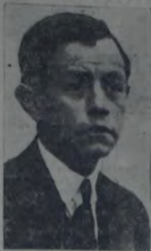
SOCIALISTA BOLIVIANO, DESTERRADO POR EL DICTADOR SILES, SE ENCUENTRA EN BUENOS AIRES Y COLABORA EN LA VANGUARDIA.