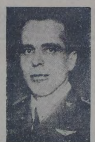
JEFE DE LA EXPEDICION ITALIANA A LAS REGIONES DEL POLO NORTE